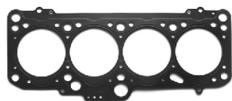
T23208 - V1M - V2M - V3M